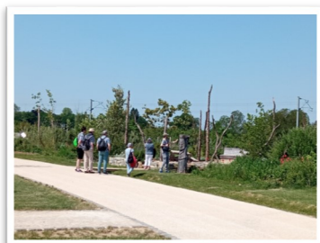
Aux Salines d'Arc et Senans