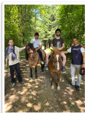
Équitation au centre d'équitation Moray