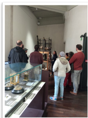
Au Musée du Temps