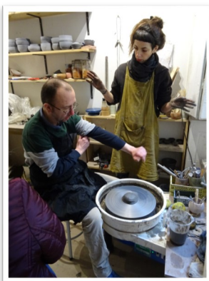
Atelier Moka Céramique (Besançon)