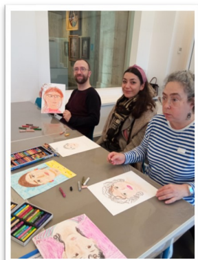
Ateliers créatifs au MBAA (Besançon)