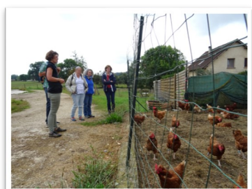
Gaëc des Arômes (Nancray)